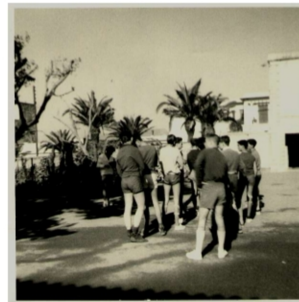
Photo prise en cours de gymnastique